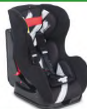
Автокресло группы I для детей массой 9-18 кг