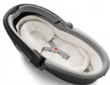
Автокресло «люлька» группы 0 для детей массой менее 10 кг

Детские удерживающие устройства подразделяют на 5 весовых групп: