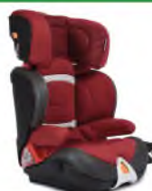
Автокресло группы III для детей массой 22-36 кг (возможно использование бустера)