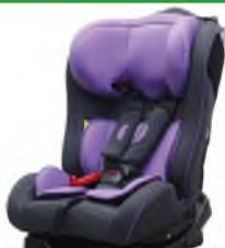
Автокресло группы II для детей массой 14-25 кг