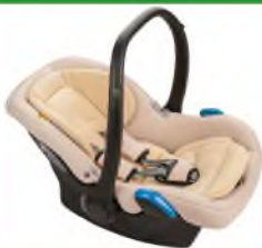
Автокресло группы 0+ для детей массой менее 13 кг