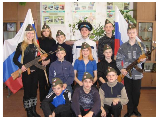
Команда 2006 г.