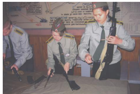
В работе команда 2005

Главная ценность «Зарницы» - возможность интересного общения со сверстниками, здоровый спортивный азарт, приобретение неординарных и порой очень нужных в реальной жизни навыков.