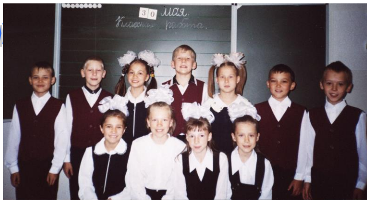
Это мы еще 3 «Б»