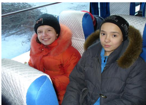
Ура! Мы едем в «Лимпопо»

что это был сон. Так прекрасно мы провели этот день! Мы бы хотели еще раз съездить в «Лимпопо», только на целый день.