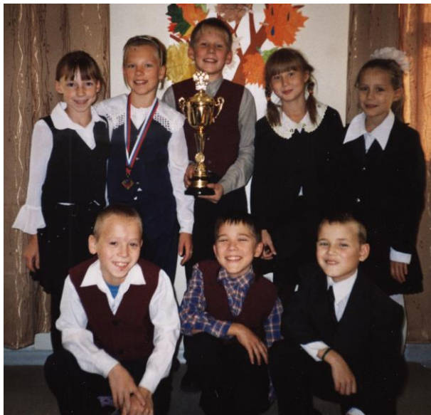
Кубок наш – хоть и один на всех