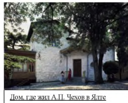
Дом, где жил А.П. Чехов в Ялте