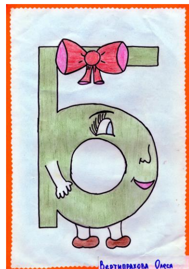
Олеся Вертипрахова, 2А