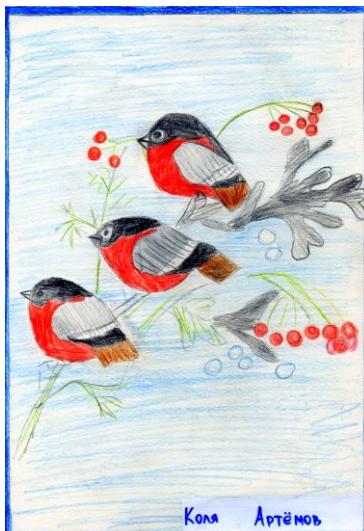
Коля Артёмов, 2А