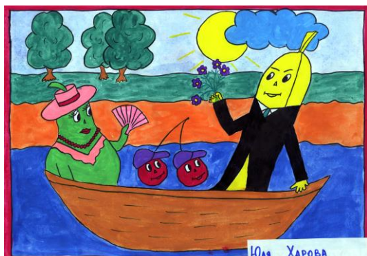
Юля Ухова, 2А