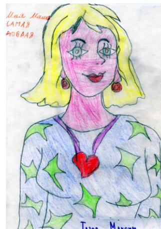
Максим Тазов, 2А