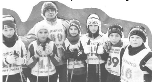
Вот и стали мы на год взрослей!