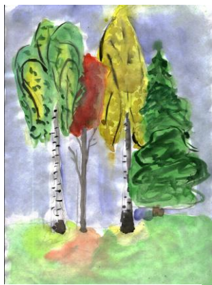
Оля Захарова, 5А