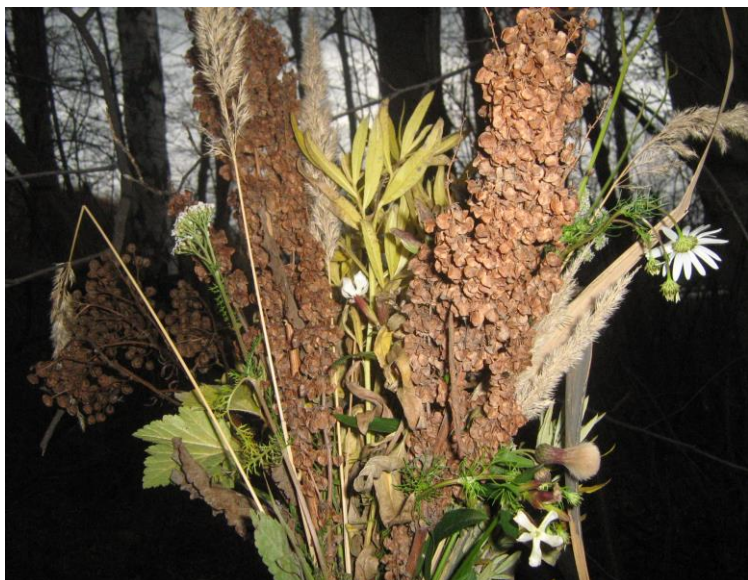
Осенний букет на Празднике Осени

Нам предстоит еще весь год учиться. Должны порадовать своих учителей:: Успехов обязательно добиться И стать еще немножечко умней.