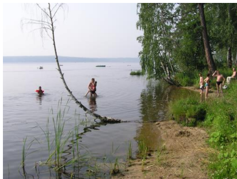
ем этаже, сам спортзал - на втором