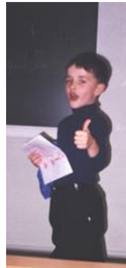
У нас в школе просто КЛАСС!